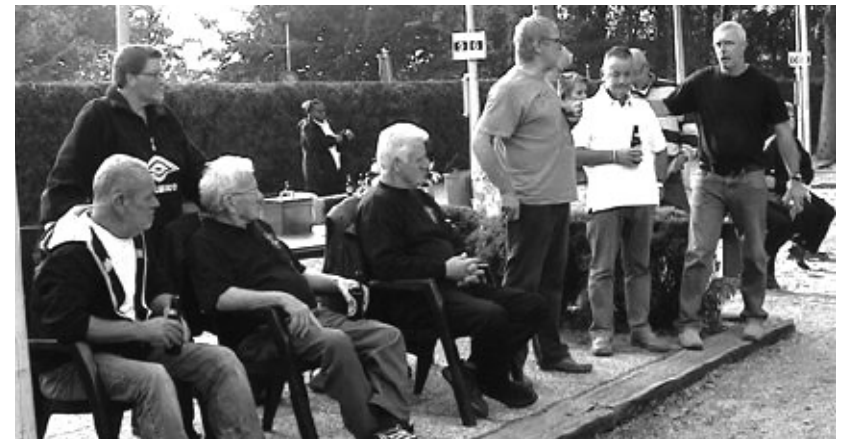
Er viel veel te kijken op zondag 12 oktober...