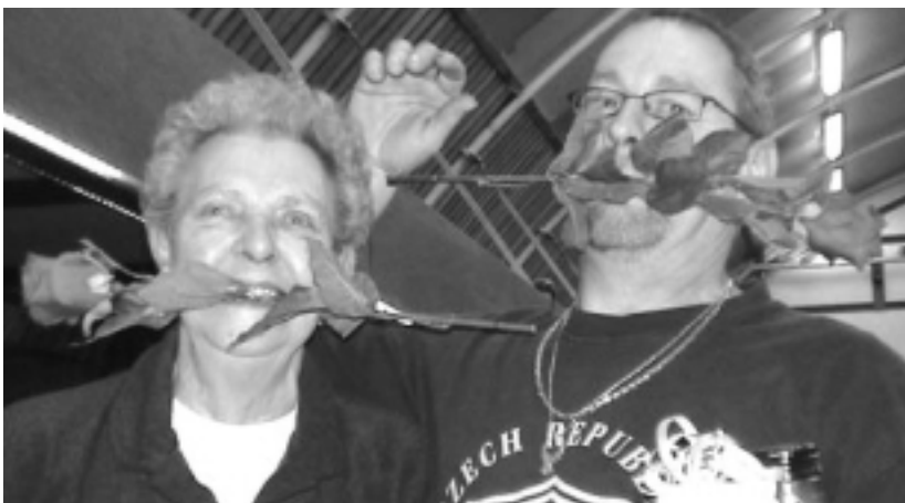
Twee bloemen zeggen meer dan duizend woorden.