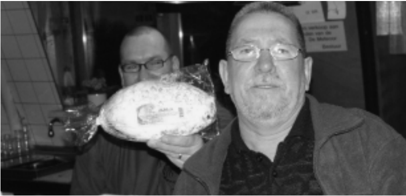
Persoonlijk ben ik meer een liefhebber van roggebrood...