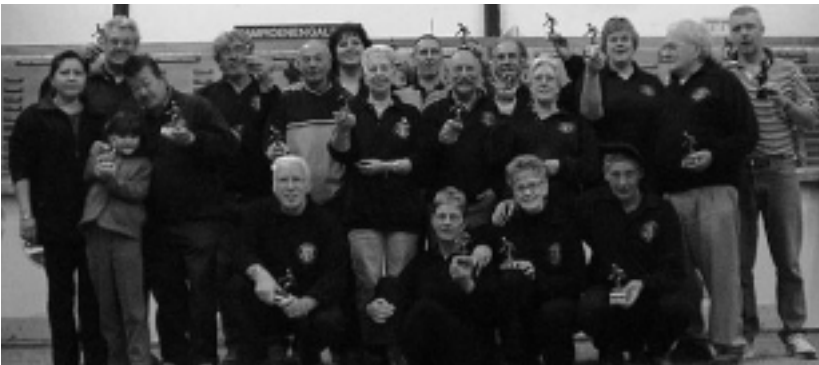
Winnaars dagprijzen Jan Voet Toernooi 12 december 2004