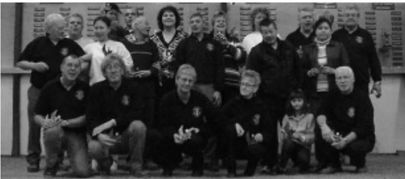
Winnaars dagprijzen Jan Voet Toernooi 9 januari 2005