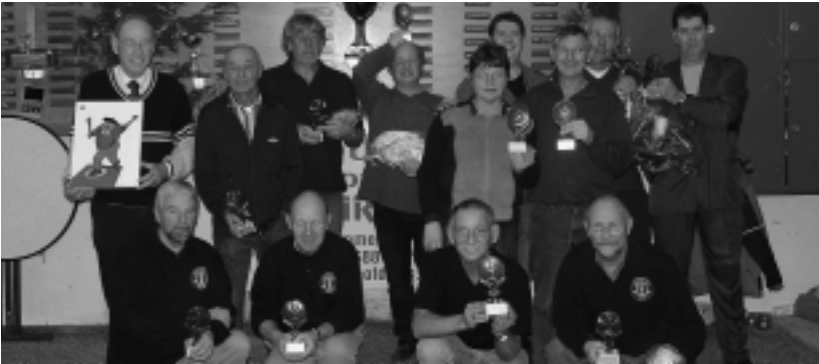
Winnaars Joop van de Loo Toernooi 18 december 2004